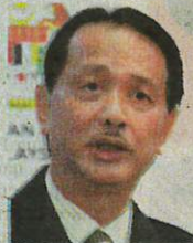
DR NOOR HISHAM

"Sebanyak 689 kes memerlukan bantuan pernafasan melibatkan 401 kes positif sementara 288 kes disyaki, kemungkinan dan kes dalam siasatan," katanya dalam kenyataan mengenai perkembangan Covid-19 pada Sabtu.