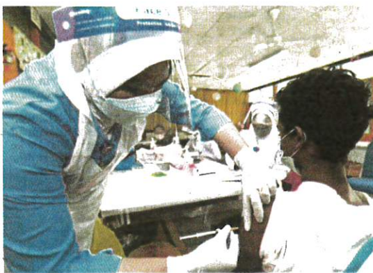
Masyarakat Orang Asli menerima suntikan vaksin jenis CanSino di Sekolah Kebangsaan Lenjang, Kuala Lipis, semalam.

Berdasarkan purata jumlah kes kematian harian sebenar selama tujuh hari, trend kematian pesakit COVID-19 menunjukkan penurunan selaras peningkatan jumlah populasi lengkap divaksin serta yang menerima sekurang-kurangnya satu dos vaksin.