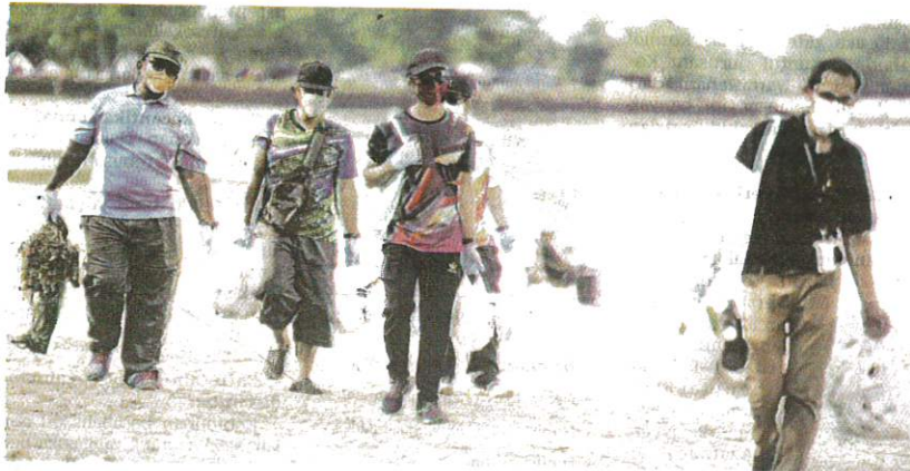
SUKARELAWAN mengutip sampah dan membersihkan kawasan pantai pada Program Pembersihan Pantai Sempena Hari Kebersihan Sedunia 2021 di Pantai Saujana, Port Dickson semalam.

Ketua Pengarah Kesihatan, Tan Sri Dr. Noor Hisham Abdullah berkata, kes harian negeri-negeri lain juga mencatatkan penurunan dengan hanya dua