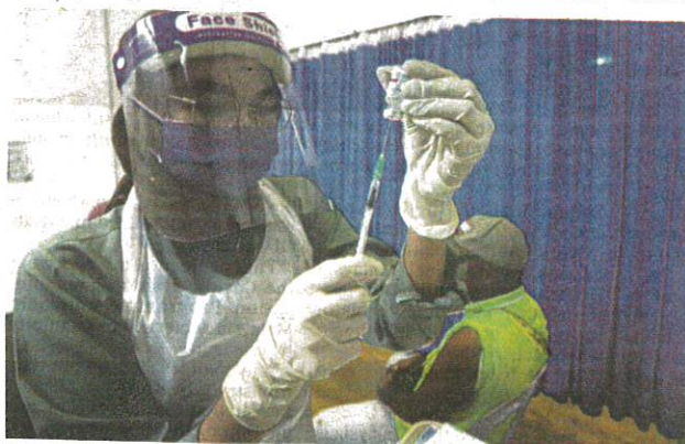
A medical frontliner preparing to administer a Covid-19 vaccine at the Dewan Milenium's vaccination centre in Kepala Batas, Penang, on Friday.

In total, 66.9 per cent of the nation's population had been vaccinated with at least one dose, while 55.5 per cent were fully vaccinated.